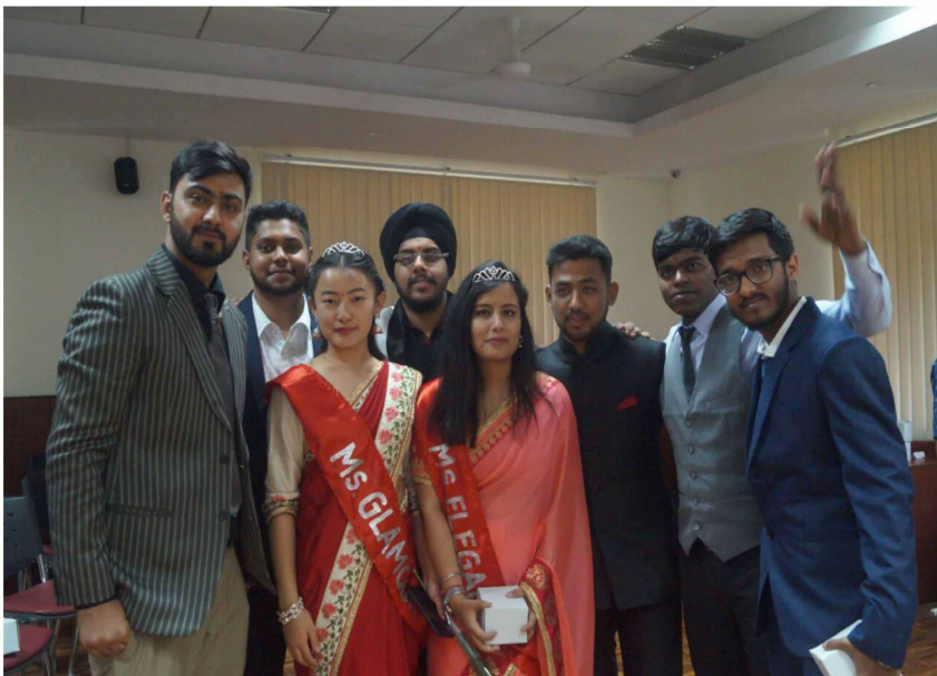
FAREWELL PARTY 2018

हमारे संस्थान (डी.आई.टी. विश्वविद्यालय) में भी सभी वर्षों की भांति इस वर्ष (20 अप्रैल 2018) को भी विदाई समारोह (फेयरवेल पार्टी) का आयोजन किया गया। इसके अंतर्गत काफी कार्यक्रम आयोजित किए गए। सब आयोजन विद्यार्थियों को केंद्र में रख के किया गया। कुछ खेल कराये गए, जैसे डब-चैरेड्स, म्यूज़िकल-चेयर्स, पेपर-डांस आदि। कुछ प्रतियोगिताओं के माध्यम से मि.फेयरवेल, मिस.फेयरवेल का भी चयन हुआ। फिर शिक्षकों ने अपने आशीर्वाद रूपी शब्दों से सबके उज्ज्वल भविष्य की कामना की। रात में सभी के लिए डी.जे. डांस पार्टी भी आयोजित की गयी। अंत में सबने मिलते रहने का वादा करते हुए, भारी मन से एक-दूसरे से विदाई ली।