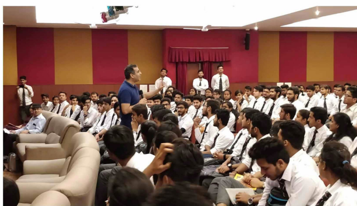
The Hackathon Workshop